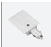
Einspeiser, Erde rechts 16A max. | Kunststoff L: 10,8 cm B: 5,5 cm H: 2 cm weiß Art. Nr. 143241