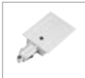
Einspeiser, Erde links 16A max. | Kunststoff L: 10,8 cm B: 5,5 cm H: 2 cm weiß Art. Nr. 143231