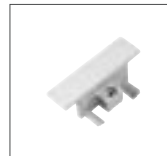
Endkappe Kunststoff L: 2,7 cm B: 5,5 cm H: 1,8 cm weiß Art. Nr. 143281