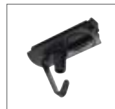
1-Phasen-Adapter mit Haken 6A max. | Polycarbonat (PC) L: 8,2 cm B: 3,5 cm H: 7,4 cm schwarz Art. Nr. 143170 weiß 143171 grau 143172