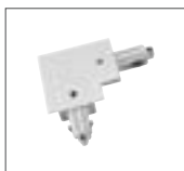
Eckverbinder, Erde außen 16A max. | Kunststoff L: 11,2 cm B: 11,2 cm H: 2 cm weiß Art. Nr. 143251