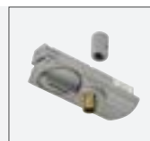
1-Phasen Leuchtenadapter 6A max. | Polycarbonat (PC) L: 8,2 cm B: 3,5 cm H: 4,2 cm schwarz Art. Nr. 143120 weiß 143121 grau 143124