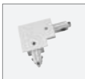
Eckverbinder, Erde innen 16A max. | Kunststoff L: 11,2 cm B: 11,2 cm H: 2 cm weiß Art. Nr. 143261