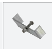
Haltebügel Stahl L: 7,5 cm B: 1,5 cm H: 4 cm nickel Art. Nr. 143230