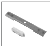
Längsverbinder 16A max. | Kunststoff / Stahl L: 6,5 cm B: 1,8 cm H: 1,7 cm weiß Art. Nr. 143271